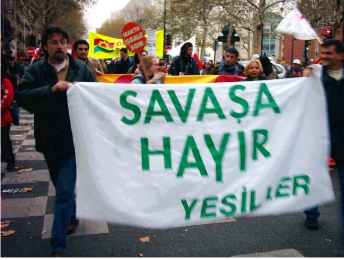
Geçen yıl Yeşiller Paris Sokaklarında