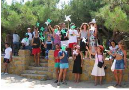
Rüzgarın gücüne inananlar